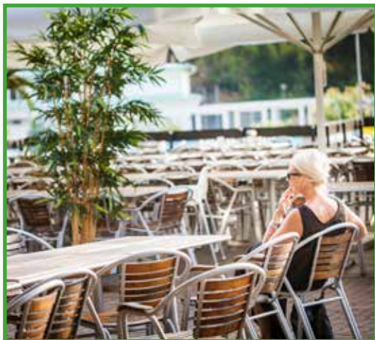
Ny fin terrass inför grillsäsongen på Brunnen.

Vi har påbörjat renoveringen av Berg och Bergs lokaler där vi fräschar upp och moderniserar kontors- och personalutrymmen. Bland annat har vi fällt in nya glaspartier och satt in LED belysning.