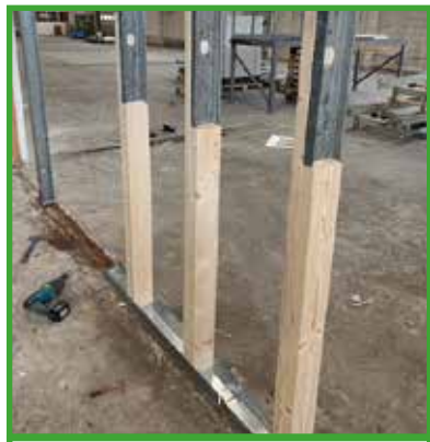
Nya väggar till Ronnebyhus.