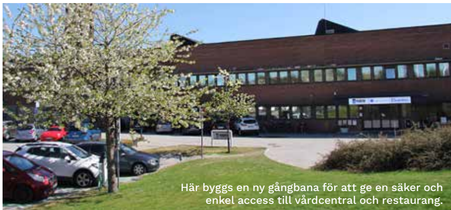
Här byggs en ny gångbana för att ge en säker och enkel access till vårdcentral och restaurang.

Även vid fastighetens västra sida blir det förändringar. Här bygger vi en ny gångbana till fastighetens entré vid Fridhemsvägen så att fotgängare säkert kan kunna ta sig till vårdcentral och restaurang utan att behöva korsa den välfyllda parkeringen.