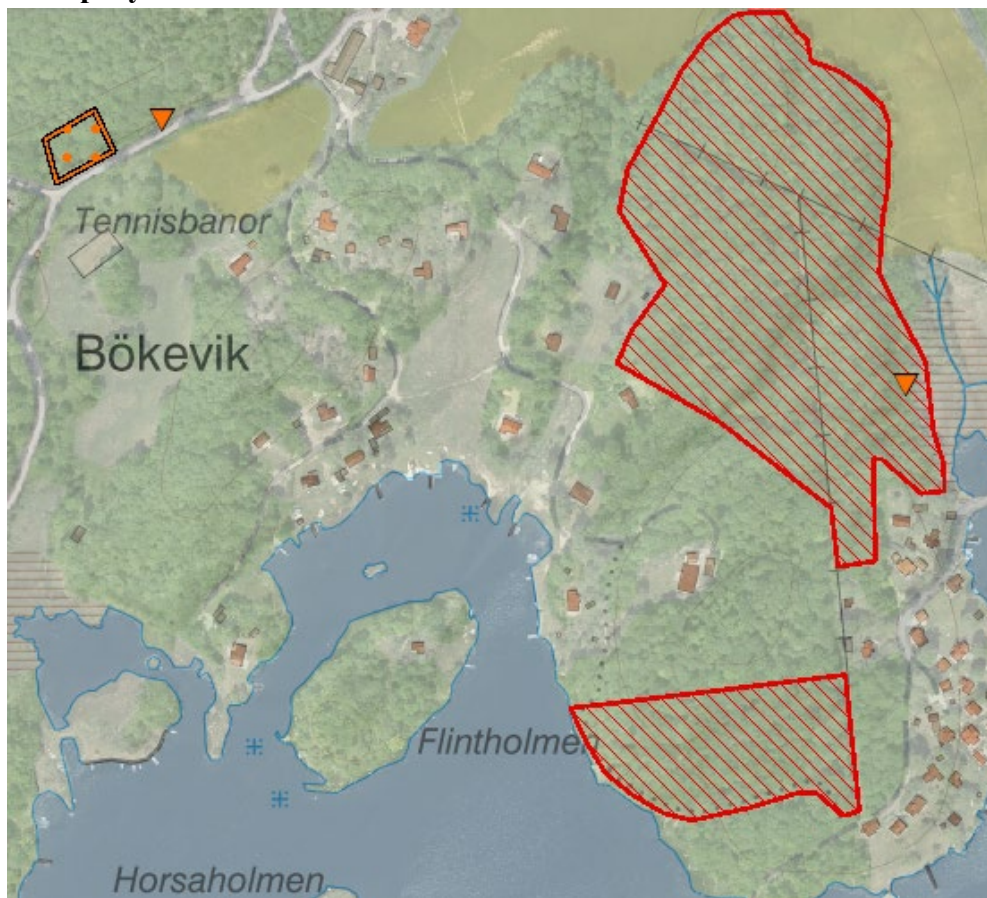
Bild från Skogsstyrelsens kartverktyg Skogens pärlor (utdrag 2021-06-20).

I Flintholmens närhet finns ett par nyckelbiotoper. Öster om Flintholmen finns en Hedädellövsskog och nordöst om Flintholmen finns en Ädellövnaturskog. I övrigt redovisas fornlämningar bestående av husgrunder och brunn. Nyckelbiotoperna rymmer särskilda värden i miljön som skapar goda förutsättningar för djur och växtliv. Planförslaget bedöms inte påverka nyckelbiotopernas fortsatta nytta för naturen.