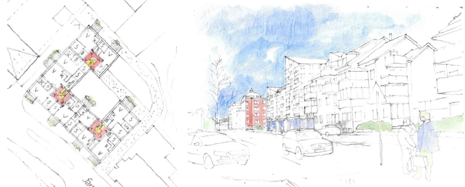
Illustrationsplan med typiskt våningsplan för ny bebyggelse på Gertrud 9 och Gertrud 10.