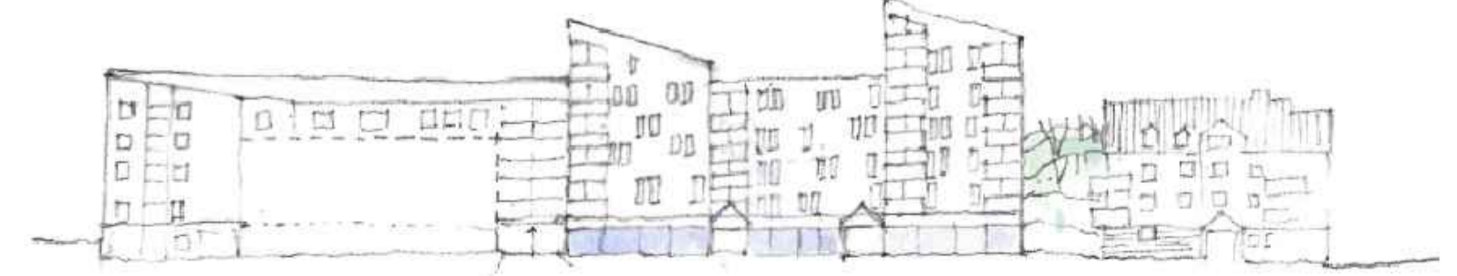
Illustration med fasad och sektion längs Järnvägsgatan.