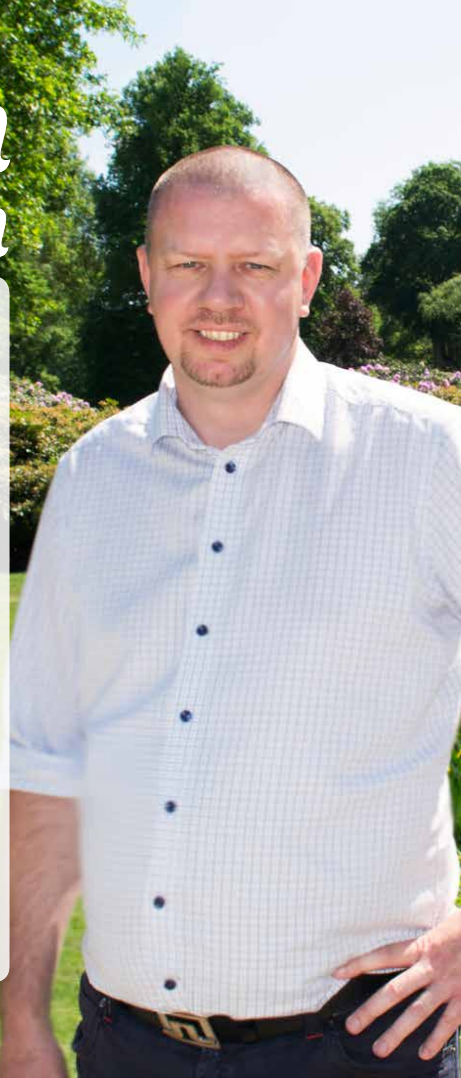
Hemma hos SID 10-11

PS: Brunnsbadet har öppnat idag, så ta med tidningen dit och njut av sommaren på redigt ronnebysätt.