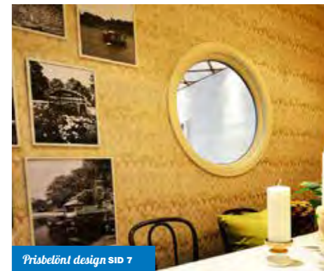
Prisbelönt design SID 7