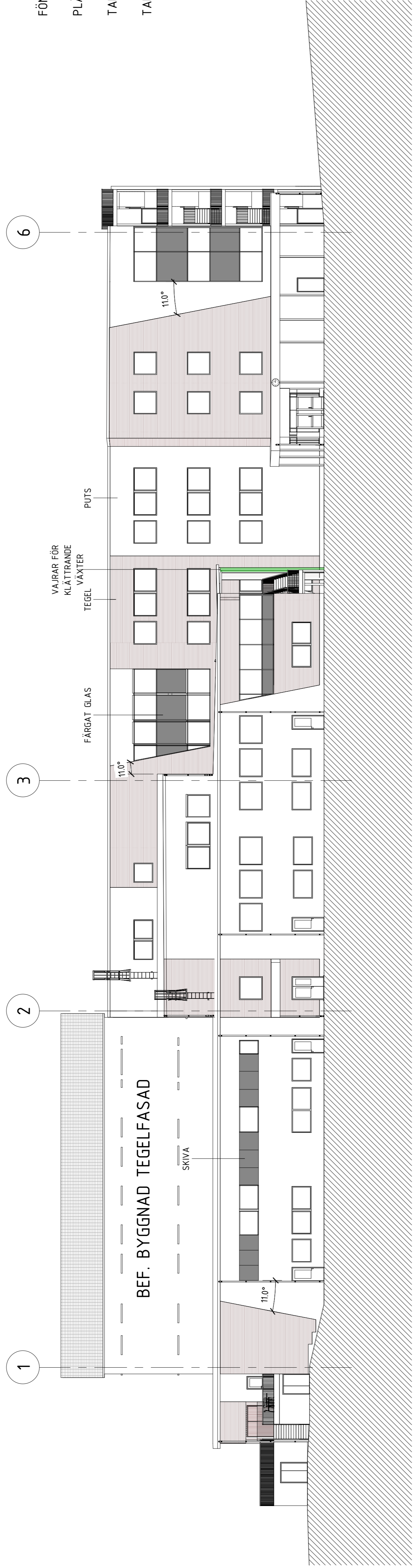
Fasad mot Sydost SKALA 1 : 200