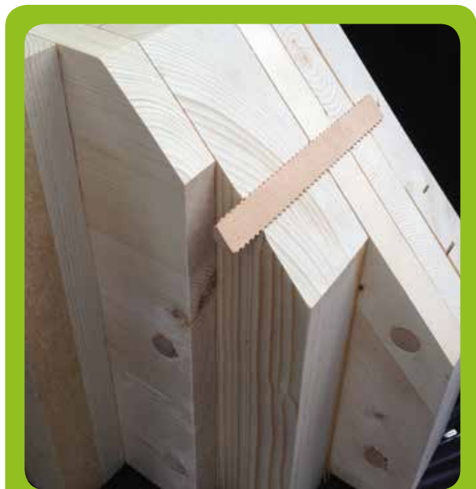
Många vill se byggnader i trä.

De idéer som framkommit om succesivt byggande hos lagen ses positivt. Samtidigt påpekas att det är viktigt att komma igång nu eftersom området inte används idag. Kommunen skulle kunna dra igång processen genom att bygga den första byggnaden, men det behöver inte vara just en byggnad som behövs för att komma igång. Många önskar att man börjar med grönstrukturen, kanske tar bort delar av Fridhemsvägen och gör en promenad längs ån. Andra idéer är att ställa iordning det röda magasinet, börja rena jorden med växter, odla eller anordna en husbilsparkering på delar av området.