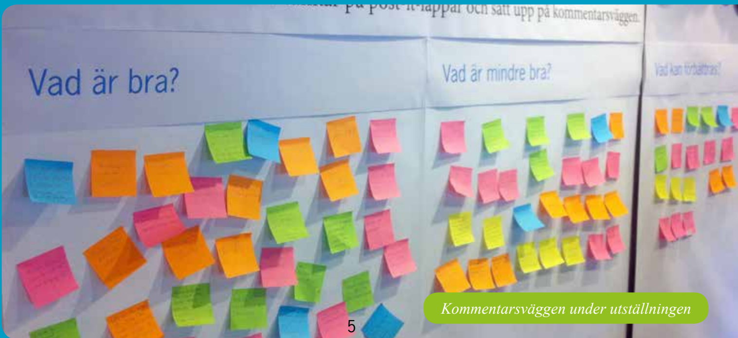
Kommentarsväggen under utställningen