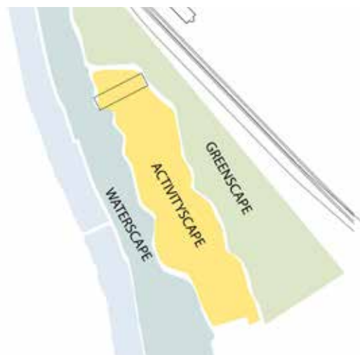
Idé om tre landskap med olika vegetationstyper på Kilen (ALoCo m.fl.)

Kilenområdet är ett skyltfönster – dels på grund av sitt läge vid resecentrum, dels på grund av projektets ambitionsnivå. Forsitt inte chansen att marknadsföra Ronneby och Ronnebys företag genom projektet och läget. Många tycker att platsen passar bra för ett showroom och/eller en representationsyta för kommunen och Ronnebys företag. Andra idéer som kommit fram med koppling till läget är ett ”Blekinge cykelcenter” i magasinet som ett center för cykelturism och ett ”Settle down center” som berättar om närmiljön och hur man går till väga för att bosätta sig i Ronneby. Det finns en stolthet över att Ronneby satsar på Kilen och Cradle to Cradle och det påpekas att man i det fortsatta arbetet måste våga ställa krav kring Cradle to Cradle. Ronneby visar vägen!