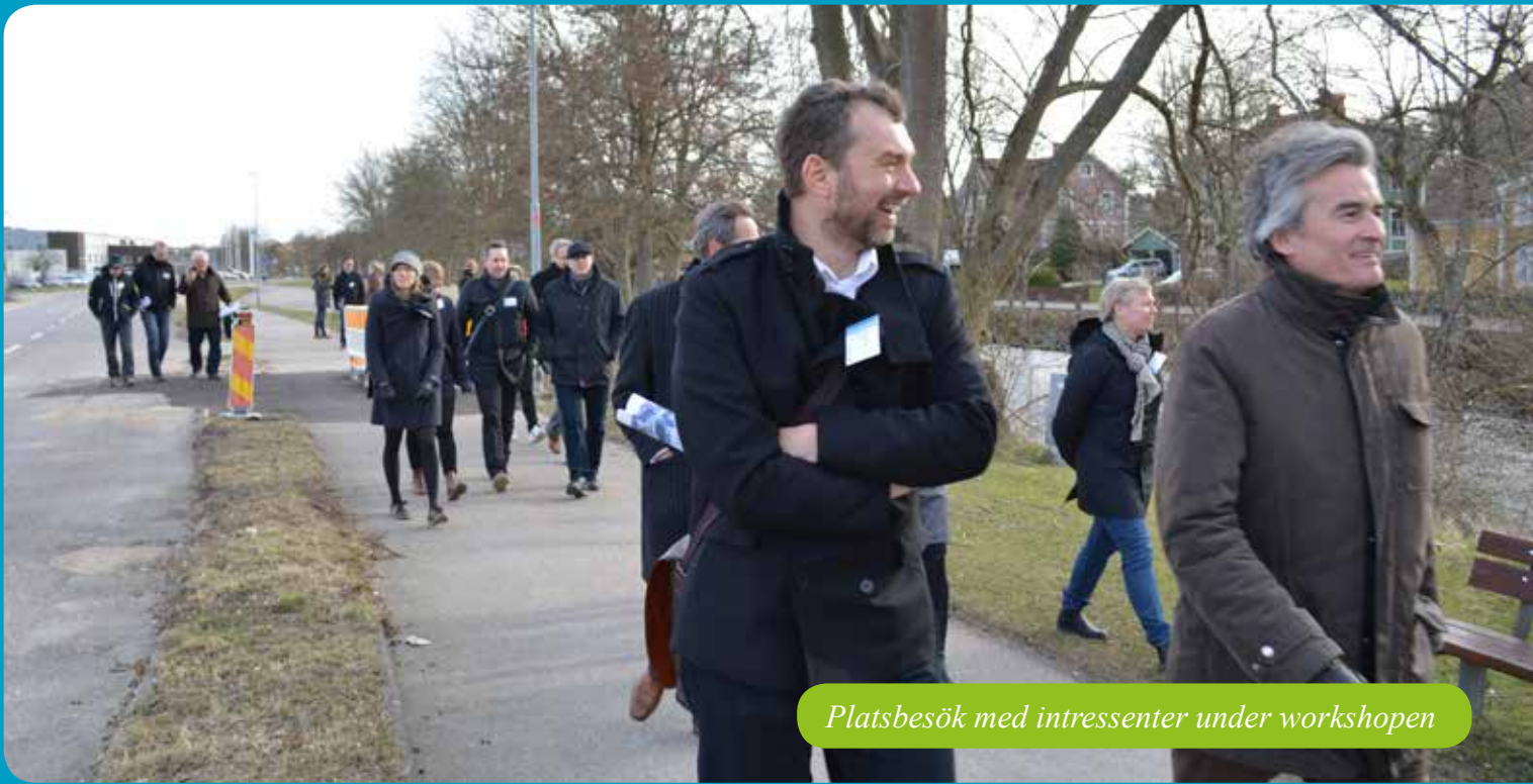
Platsbesök med intressenter under workshopen