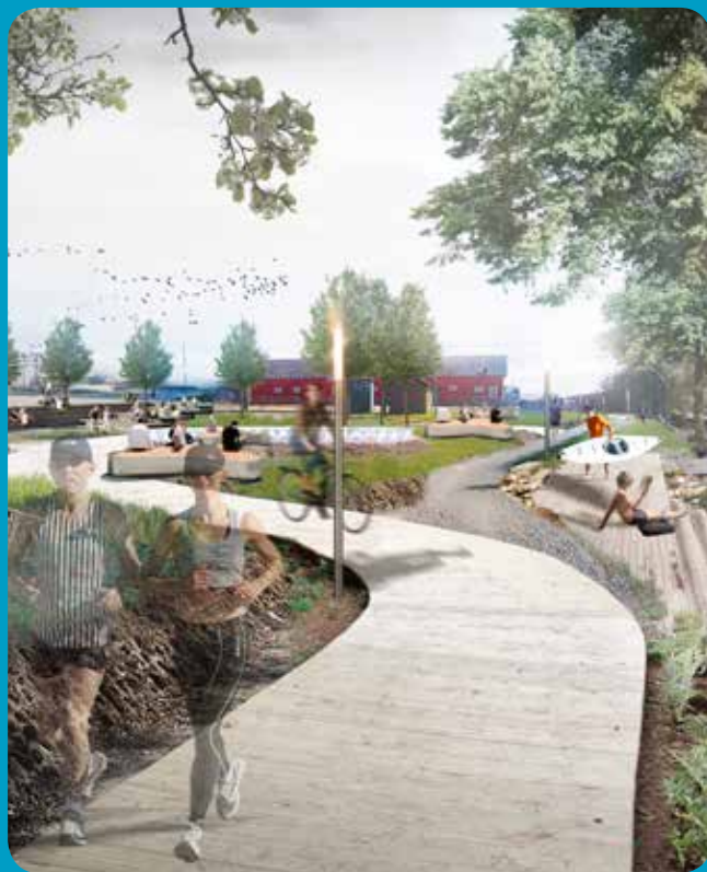
Många vill att området skall vara öppet för allmänheten och inte kännas för privat, exempelvis som på den här bilden (ALoCo m.fl.)

Det röda magasinet på området är mycket omtyckt och i princip alla vill behålla det. Det beskrivs som en viktig kulturhistorisk länk som man bör behålla för att visa på historien. Det får gärna öppnas upp och bli en mötesplats för alla Ronnebybor med café, marknad, anslutande växthus, showroom eller kulturaktiviteter. DHL-byggnaden tycker man inte ska sparas på sikt.