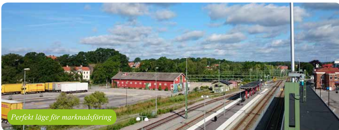
Perfekt läge för marknadsföring