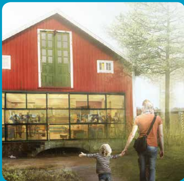
I princip alla vill behålla det röda magasinet (GXN m.fl.)