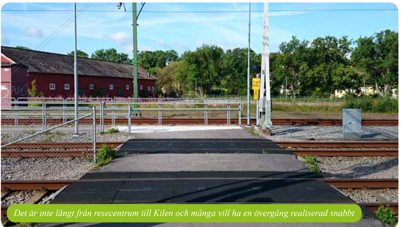
Det är inte långt från resecentrum till Kilen och många vill ha en övergång realiserad snabbt

Många trycker på att området skall vara öppet för allmänheten och inte kännas för privat. Det ska snarare bli en samlingsplats för alla i hela staden och kännas inbjudande. Många har önsknings om