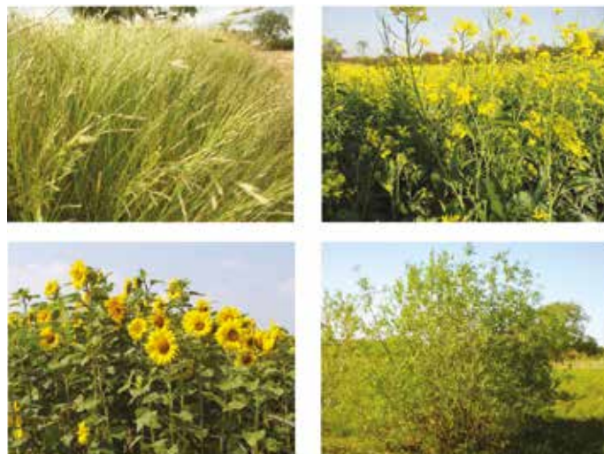
Exempel på växter som kan användas för att rena jorden (LIAG m.fl.)

Alla lagen har en park som grunden i sitt förslag och det tycker man om. En grön stadsdel som för tankarna till naturen och ger känsla av både stad och park är något man efterfrågar. Grönskan ska vara vacker men också funktionell på så sätt att den utför olika tjänster. Det kan röra sig om jord- och vattenrening, att öka den biologiska mångfalden och skapa bra mikroklimat. Att arbeta med olika typer av landskap kan vara ett intressant sätt att synliggöra landskapets variation. Grönska på platsen är något man efterlyser nu direkt och den får gärna användas på ett innovativt sätt för att skapa strukturer och attraktivitet i området.