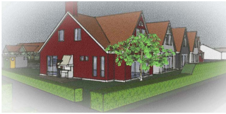
Perspektiv- alternativ 1