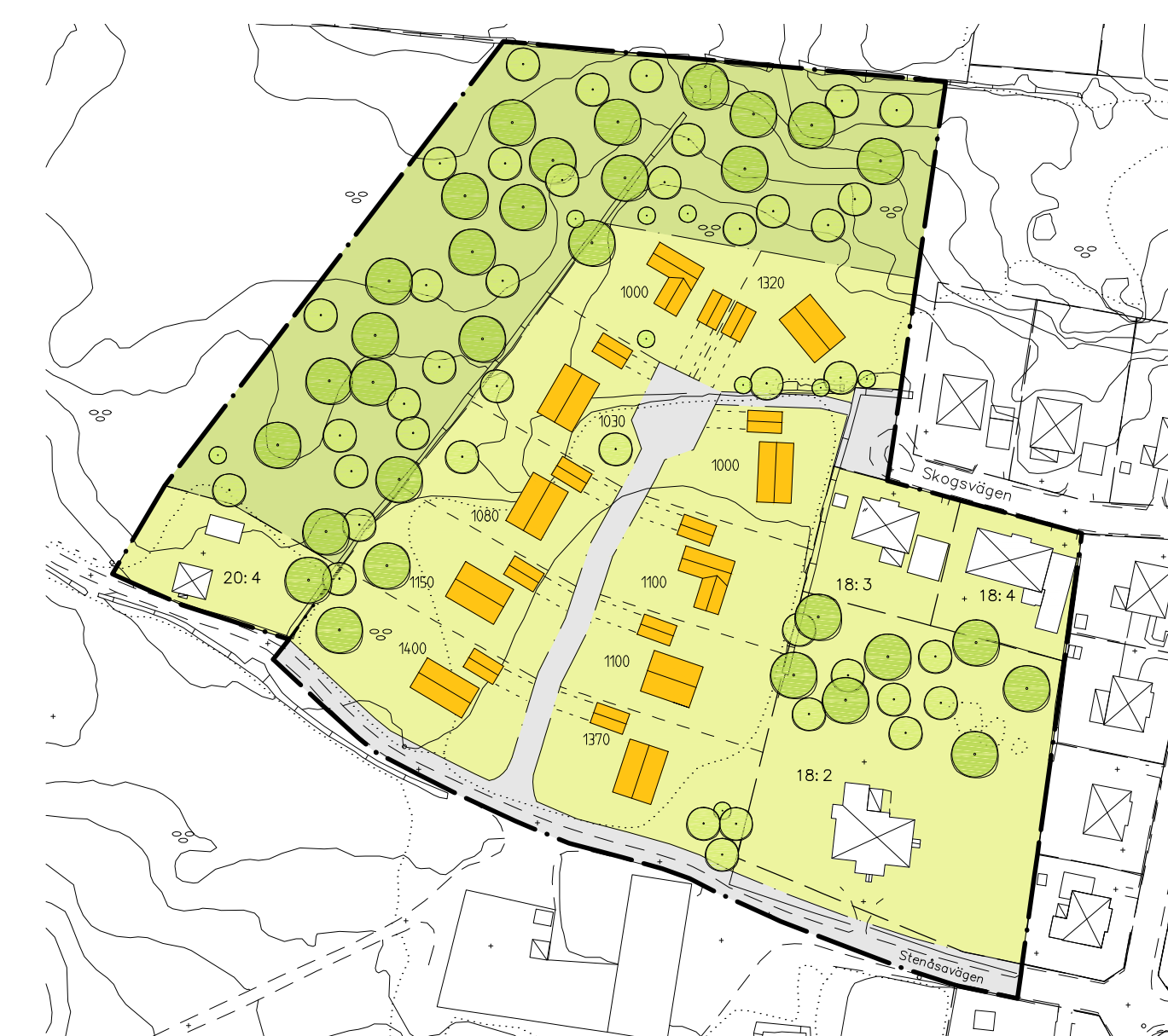
ILLUSTRATION A, 1:1500

Illustration A visar ett förslag med 10 stycken friliggande villor med tillhörande garage. Tomtstorleken varierar från 1000 kvadrater till 1400 kvadrater.