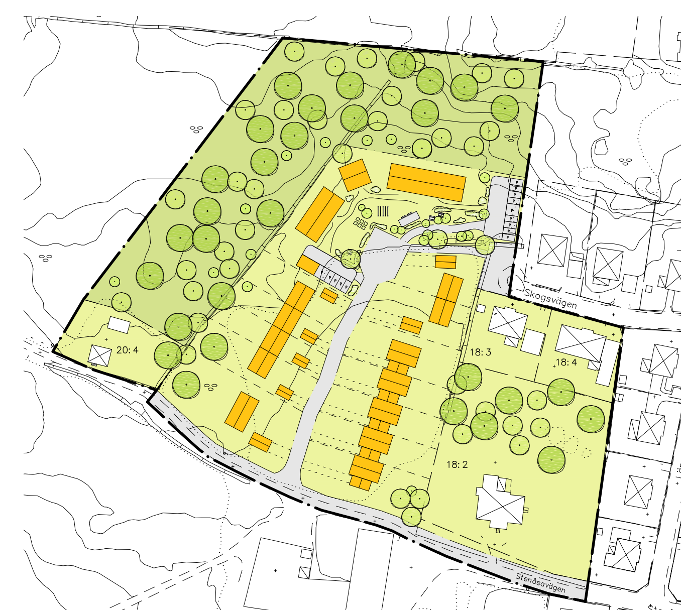
ILLUSTRATION B, 1:1500

Den planerade bostadsbetyggens typologi är inte bestämmd och regleras inte heller i detaljplan. Illustrationen visar endast exempel på hur olika byggnadstyper kan placeras.