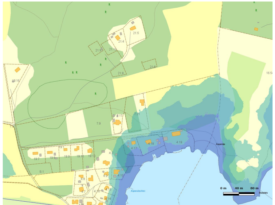
Bild 1. Område som påverkas av en havsnivåhöjning på 1,2 respektive 3 meter över havsnivån.

området. På detta sätt bedöms strandskyddsområdet inte påverkas negativt och säkerhetsnivåerna på den byggbara marken hållas.