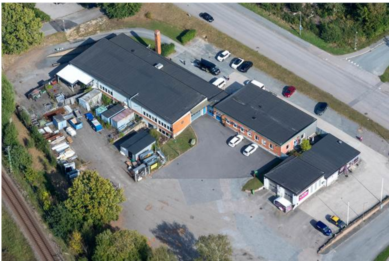
Sörbyvägen 9, Hjulet 1, Ronneby - Lager & logistik | Kontor | Övrigt