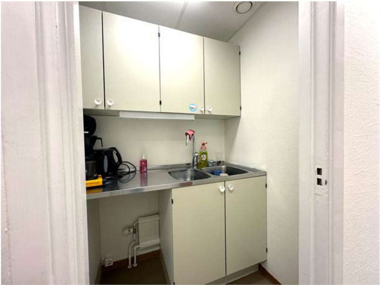
Pentry vid kontor