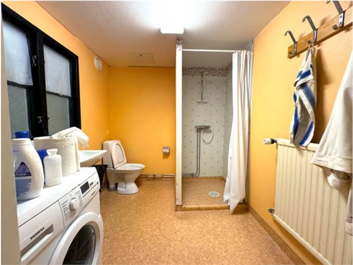
Dusch och tvättmöjligheter