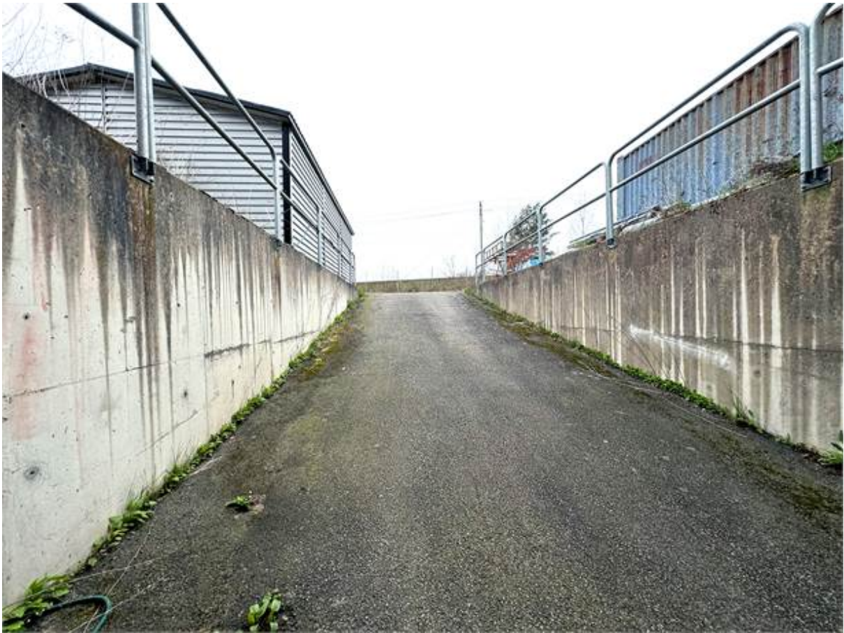
Uppfart från varmlager