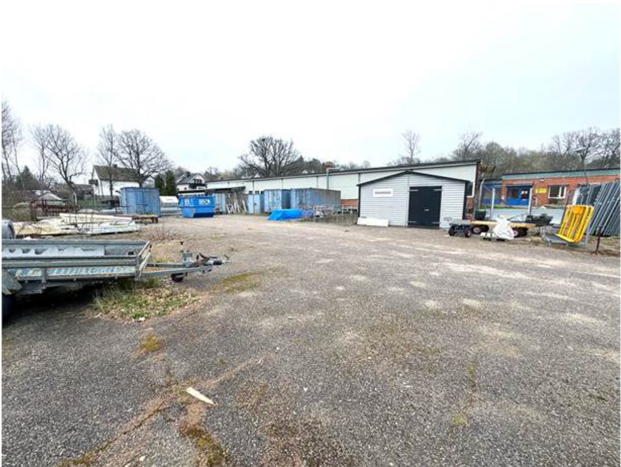
Asfalterad inhägnad yta