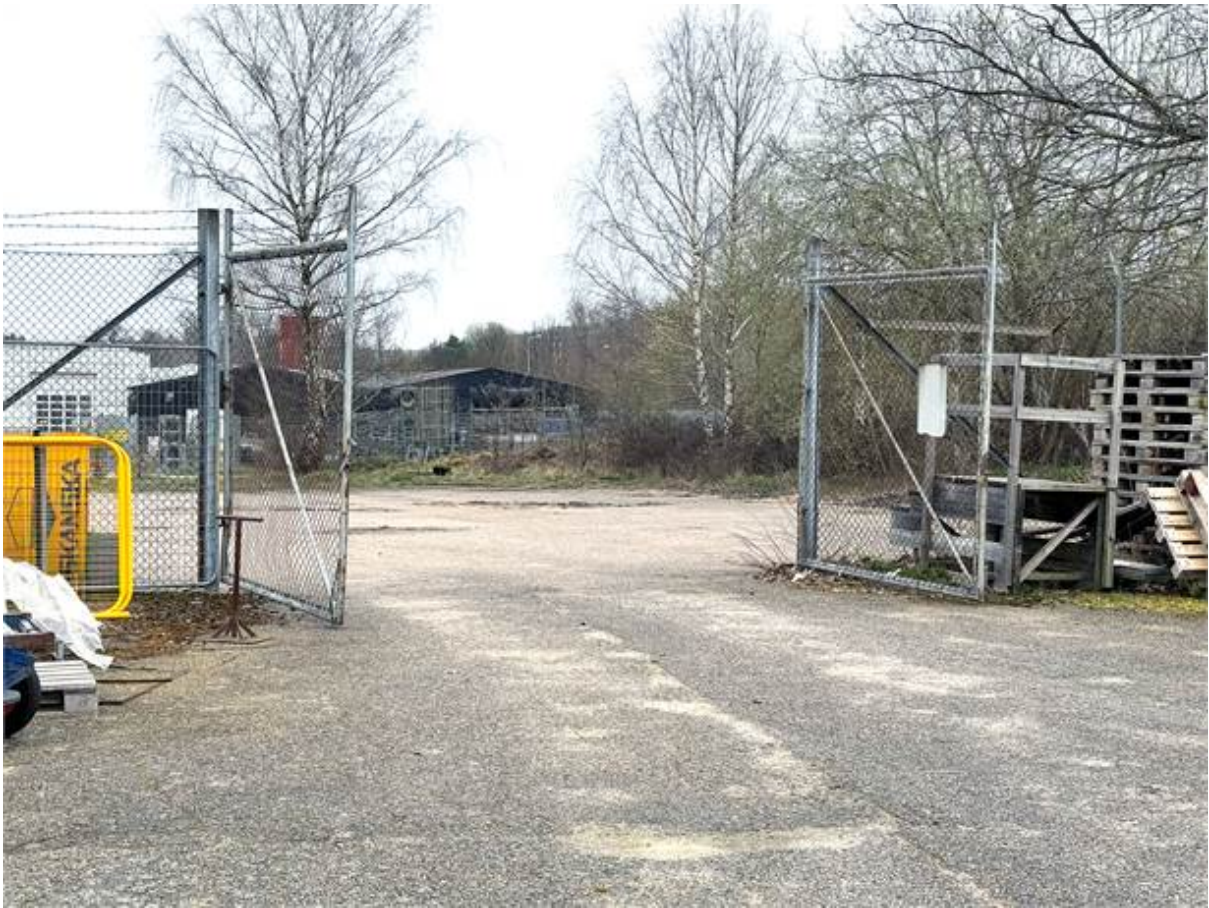
Grind asfalterad yta utomhus