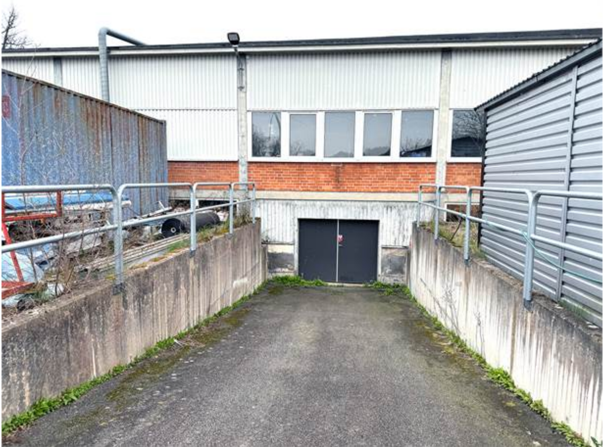
Nedfart till varmlager