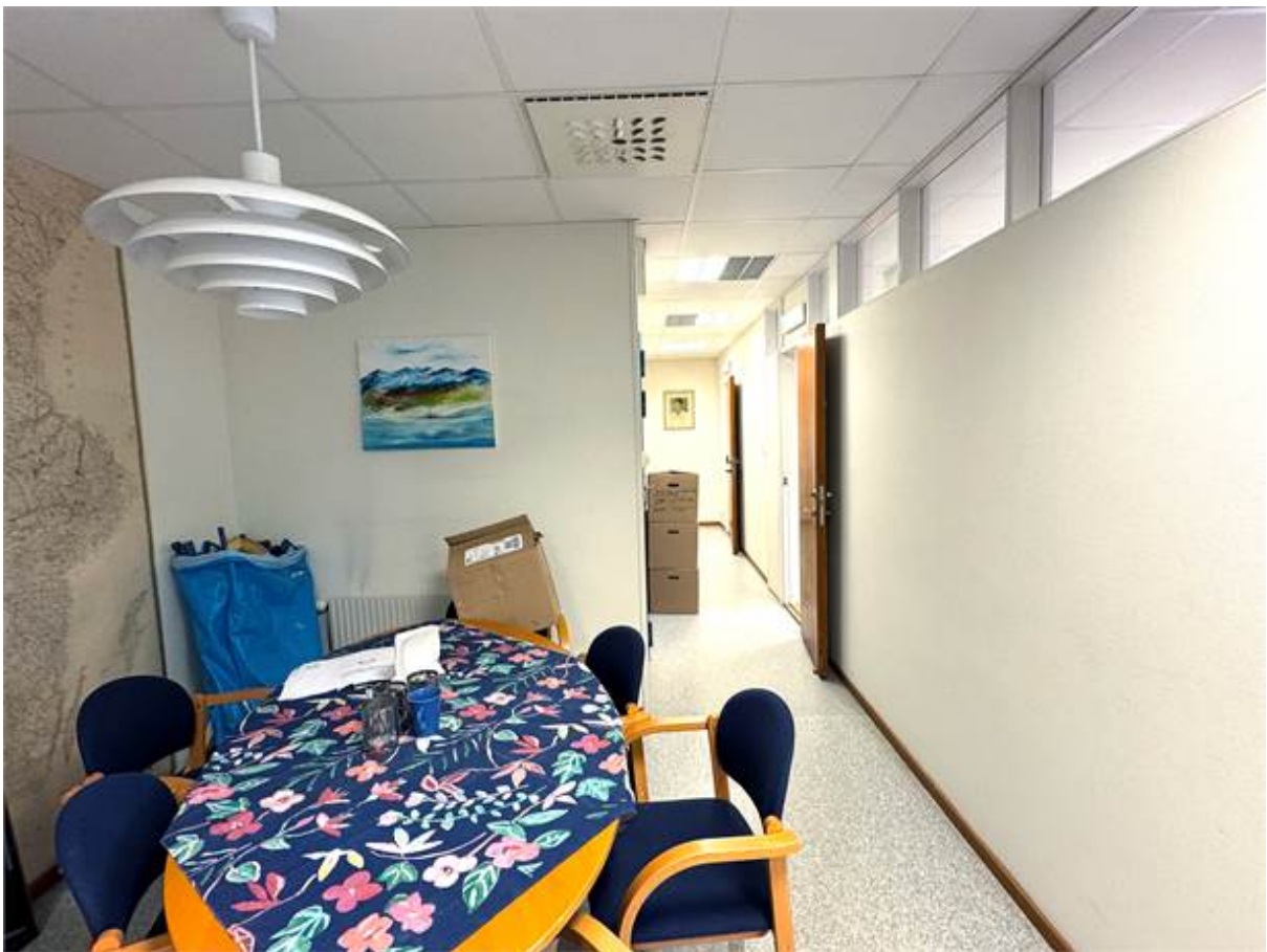
Samlingsrum vid entré