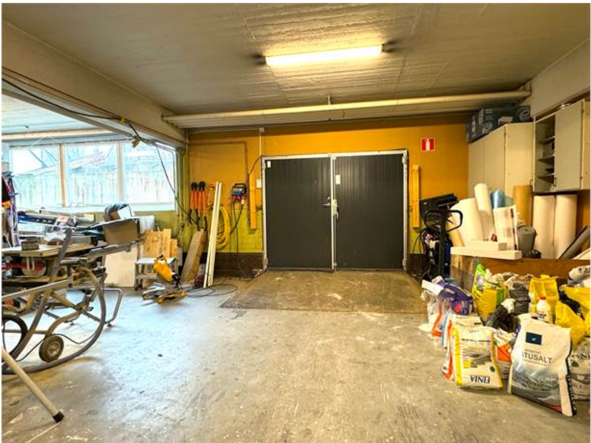
Port till asfalterad innergård