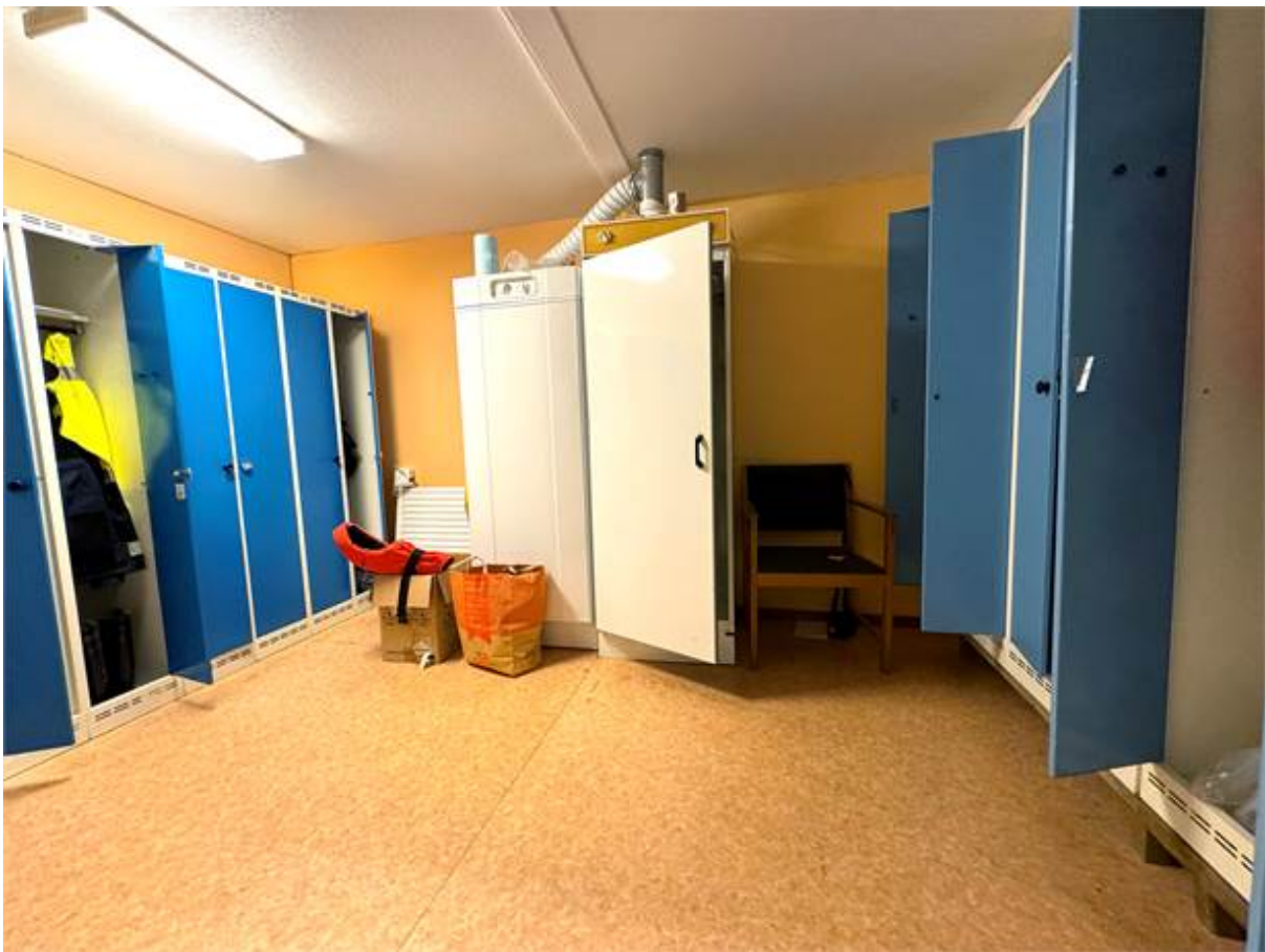
Omklädningsrum med torkskåp