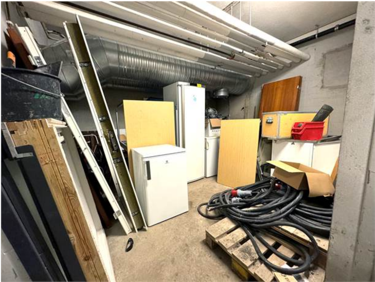
Låsbart lager (ett av tre)