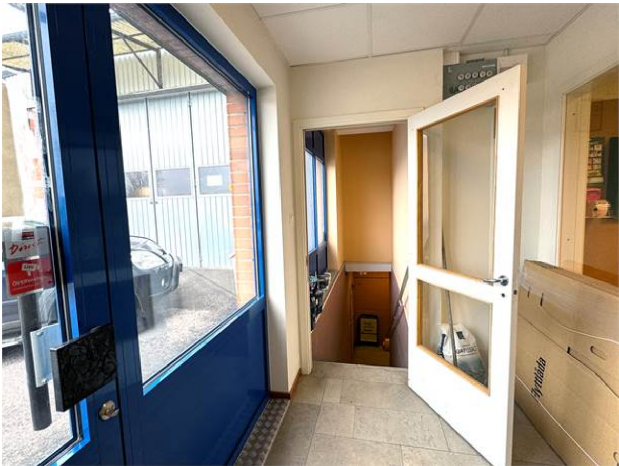
Nedgång plan -1 till varmlager och omklädningsrum