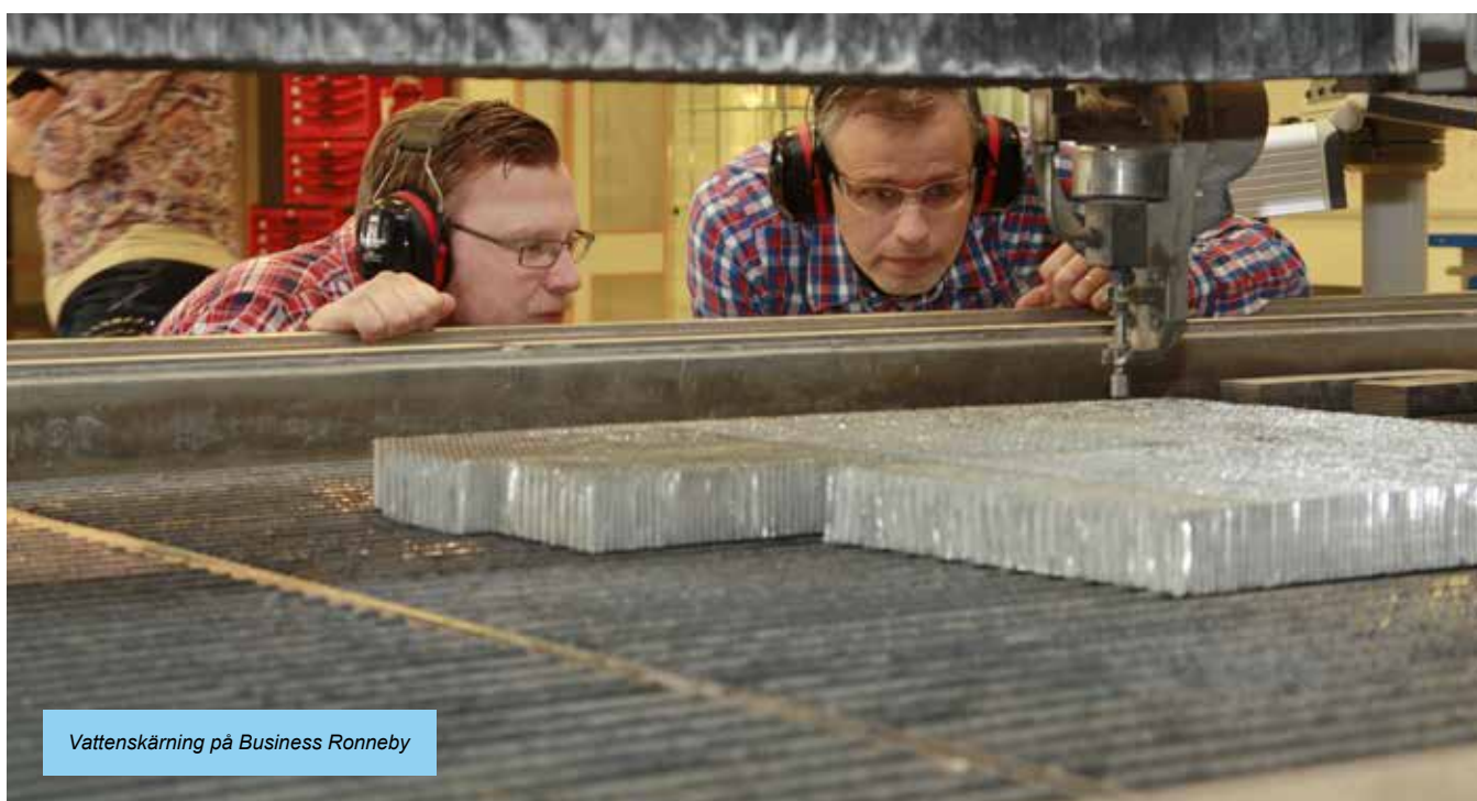
Vattenskärning på Business Ronneby